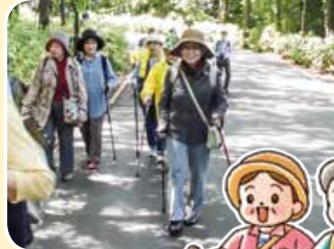
▲ノルディックウオーキング