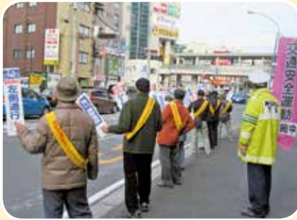
▲交通安全街頭キャンペーン