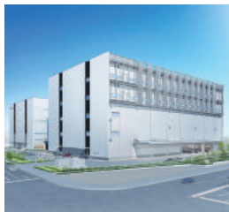
現在、2号館を着工、テナントを募集中