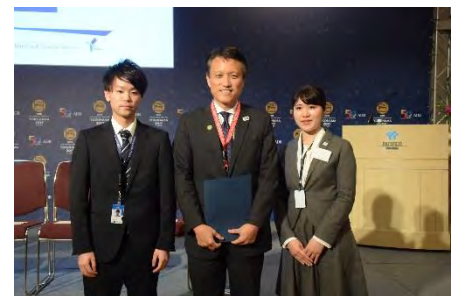
ADB ウム官房長へ提言書を贈呈