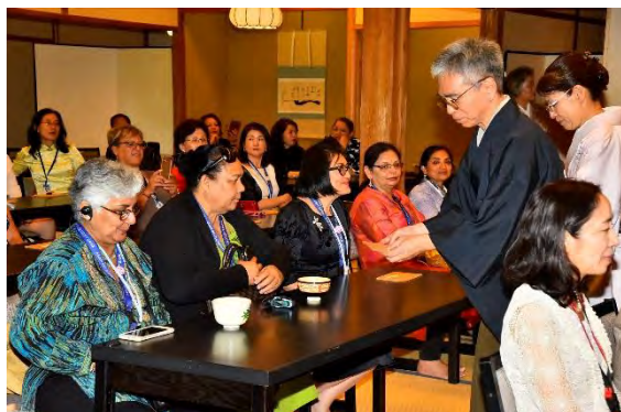
三溪園で茶道体験