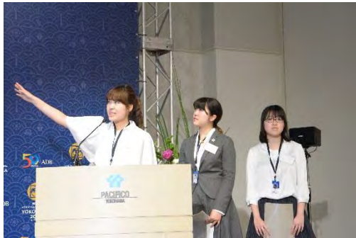
横浜国立大学・横浜市立大学による発表

横浜国立大学、横浜市立大学、フェリス女学院大学、神奈川大学、明治学院大学、慶応義塾大学、東京大学、明治大学、東京外国語大学、京都大学、東京工業大学、早稲田大学、フィリピン大学