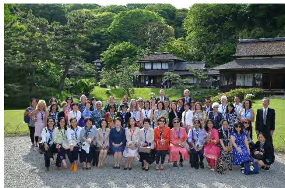
三溪園にて記念撮影