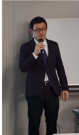
<㈱三菱総合研究所からのプレゼンテーション、質疑応答>