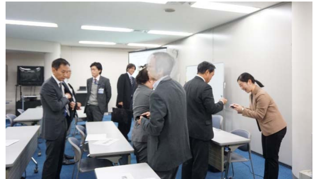
<名刺交換会の様子>