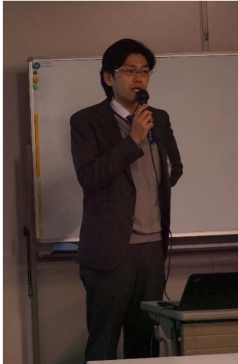
<横浜市からのプレゼンテーション>