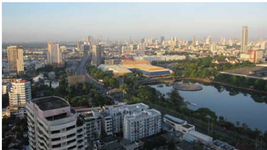
気候変動マスタープランの策定を進めているバンコク都の都心部