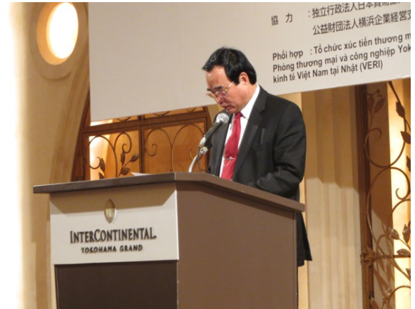
チェン委員長ご挨拶