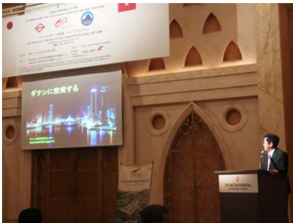
投資促進センターによる講演