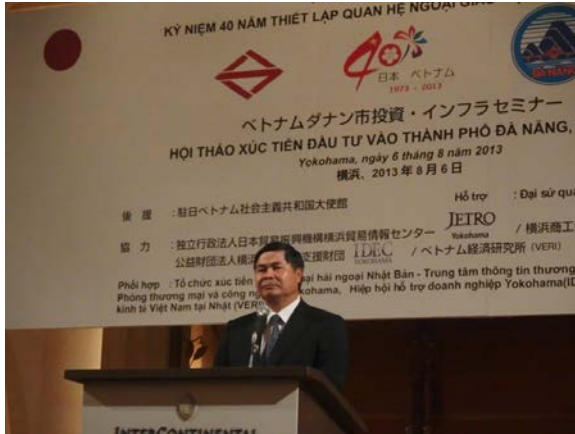
フン駐日大使ご挨拶