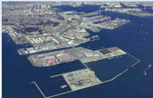
Bến Minami Nonmoku, một trong những bến cảng lớn nhất trên thế giới

Khu vực sau các bến container là trung tâm logistics tổng hợp mới được trang bị với kho phân phối, trung tâm dịch vụ giao hàng và tổ hợp bến phân phối.