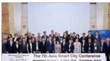
第7回アジア・スマートシティ会議(2018年)