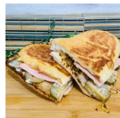
& me 「ハマナンサンド」

概要：地元横浜の食材を使用した「炙り焼き豚丼」やジャークチキンをナンで挟んだ「ハマナンサンド」などのフードから、日本ではまだ珍しい、タピオカを使った「バブルワッフル」といったスイーツまで、バラエティー豊富なラインアップのキッチンカーが並びます。新鮮な牛乳を使ったスイーツが人気の相鉄線沿線のお店も出店。