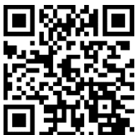
X (旧 Twitter)