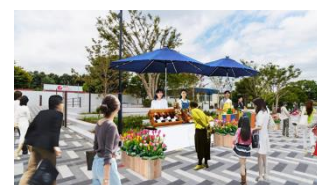
Yokohama Nature マルシェ (イメージ)

概要：地元の新鮮野菜や雑貨など、心地よい暮らしのためのアイデアに出会えるアイテムの販売や、リサイクルパーツなどを使用したサステナブルなワークショップを実施。