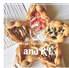
and RE 「バブルワッフル」