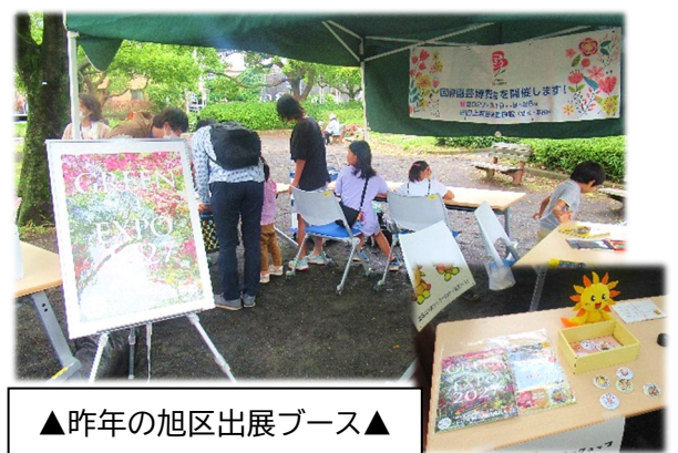
▲昨年の旭区出展ブース▲

※ その他、イベントの詳細は、別添相鉄グループリリース資料及び公式ウェブサイト（ https://www.sotetsu.co.jp/ynw/ ）をご覧ください。