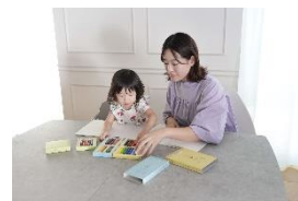
おやさいクレヨンぬりえ体験会 by mizuiro