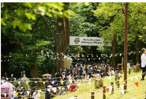
「Yokohama Nature Week 2023」開催時の様子