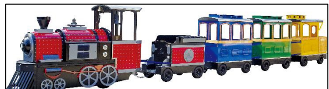
「Yokohama Nature トレイン」（イメージ）