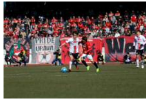
平成29年2月12日(日) 「さいたまシティカップ」