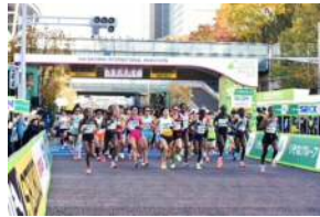
平成28年11月12日(土)・13日(日) 「さいたま国際マラソン」