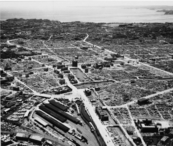
大空襲直後の横浜市街桜木町駅