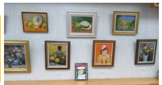
《杉田地区センターロビーにて》