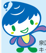
泉区マスコットキャラクター「いっずん」

横浜市内の南西部に位置し、瀬谷区・旭区・戸塚区・藤沢市・大和市に接しています。泉区では、区の地域資源となっている農業を最大限に生かし、区の集客力向上と地産地消の促進を図ることなどを目的に、「いずみ自慢」の発行をはじめとした「農を生かしたまちづくり事業」を推進しています。このマップを活用して、泉区の旬の味をお楽しみください!