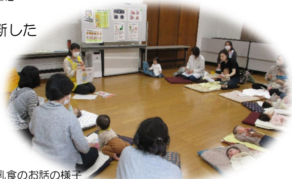
離乳食のお話の様子