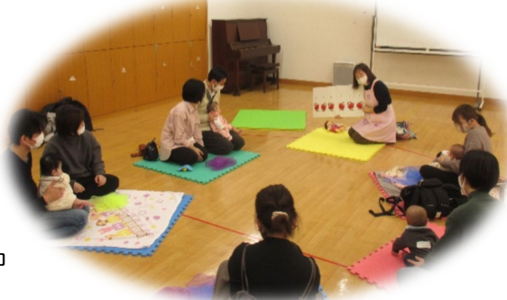
大きい絵本の読み聞かせ

また、これ以外でも状況によって危険であると判断した場合、中止することがあります。