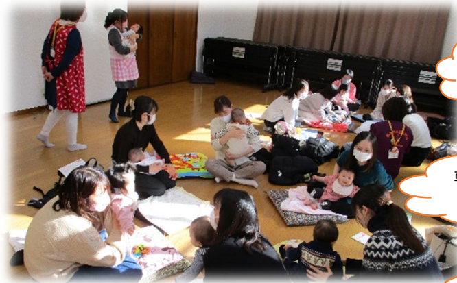
情報交換 ～お子さんの最近の様子や遊び場情報について お話しをしています～