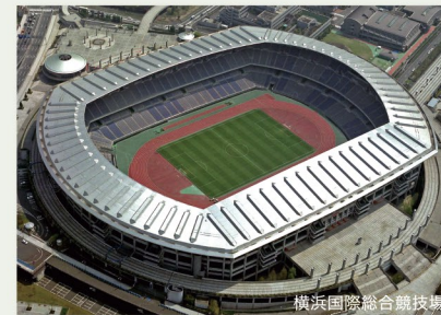
横浜国際総合競技場

市内最大の運動公園で鶴見川多目的遊水地も兼ねています。公園内には、陸上競技やサッカーなどの国際大会が開催できる日産スタジアム（横浜国際総合競技場）、野球場、テニスコートのほか、遊具広場やドッグランなどのレクリエーション施設もあります。また、メドウガーデンなど生き物の生息空間も持ち合わせた多目的な公園です。