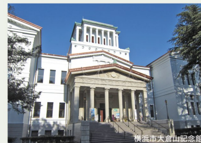
横浜市大倉山記念館