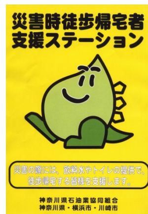
災害時徒歩帰宅者支援ステーションステッカー