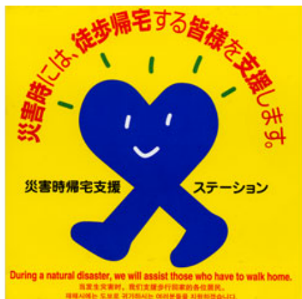
災害時帰宅支援ステーションステッカー

さらに、市本部長又は区本部長は、都市部からの徒歩帰宅者の通行が想定される幹線道路沿いに、一時的な休憩場所や災害関連情報を提供するための「支援拠点」を設置し、徒歩帰宅者の安全な帰宅を支援します。