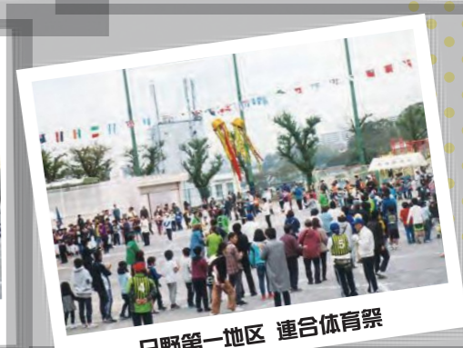
日野第一地区 連合体育祭