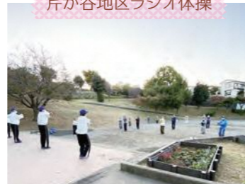
芹が谷地区ラジオ体操

毎年新任研修会や 全体研修会を開催し 正しいラジオ体操の仕方や 競技のルールを 研修しています