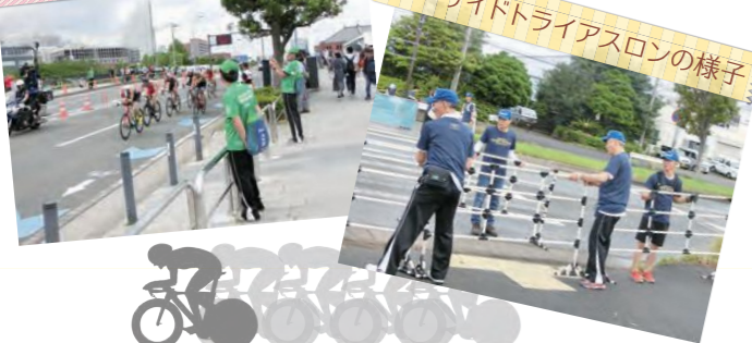
シーサイドトライアスロンの様子