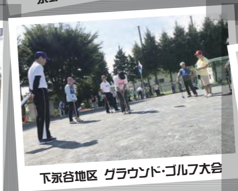
下永谷地区 グラウンド・ゴルフ大会