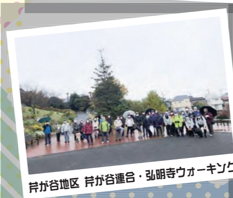
芹が谷地区 芹が谷連合・弘明寺ウォーキング