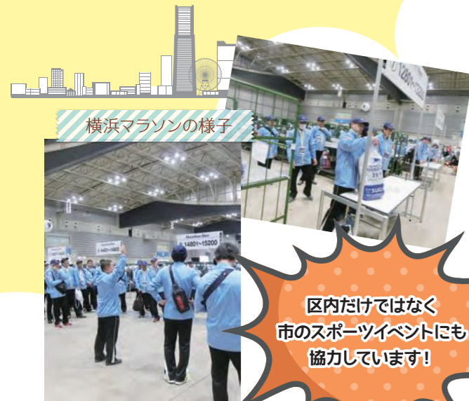
横浜マラソンの様子