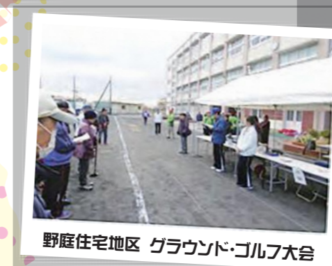
野庭住宅地区 グラウンド・ゴルフ大会