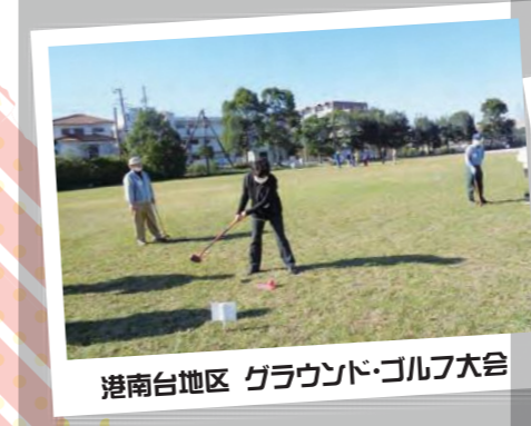
港南台地区 グラウンド・ゴルフ大会