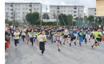
健康ランニング大会の様子