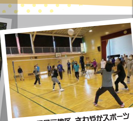
大久保最戸地区 さわやかスポーツ