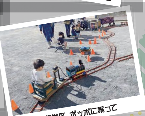
永谷地区 ポッチャに乗って