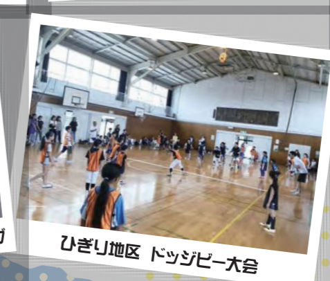
ひざり地区 ドッジビー大会