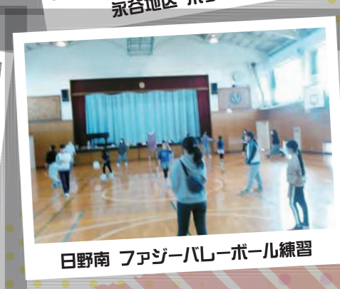
日野南 ファジーバレーボール練習