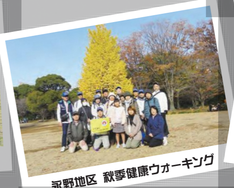
永野地区 秋季健康ウォーキング