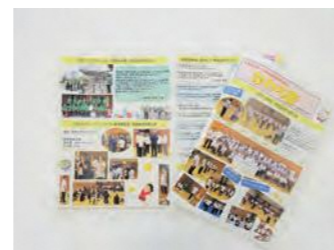
かわら版(令和元年度発行)