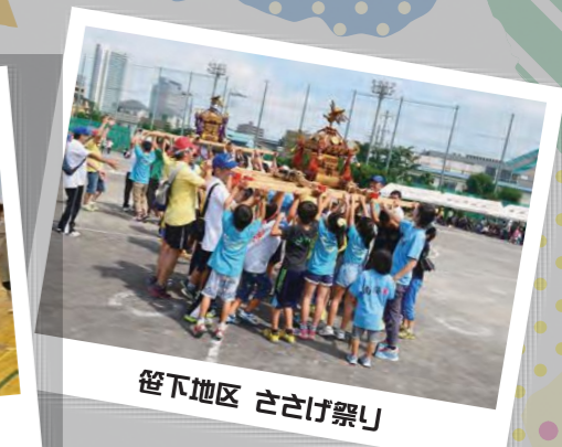
笹下地区 ささげ祭り