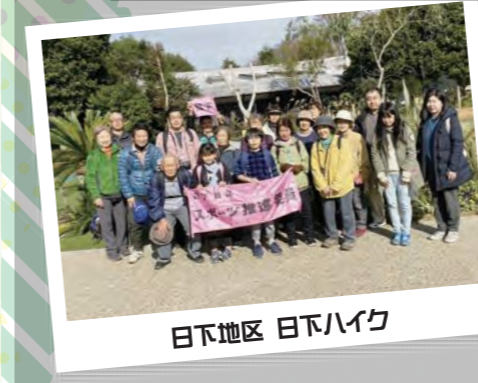
日下地区 日下ハイク