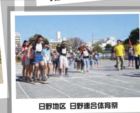
日野地区 日野連合体育祭