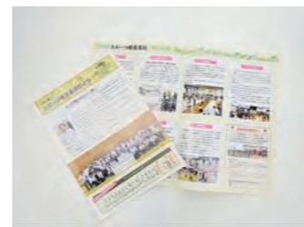
スポーツ推進委員だより(令和元年度発行)

今年度はいろいろなイベントが中止となり、ご報告できる活動が限られてしまいましたが、来年度以降も継続して広報活動を続けていきたいと考えています。