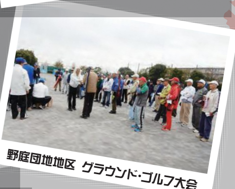
野庭団地区 グラウンド・ゴルフ大会