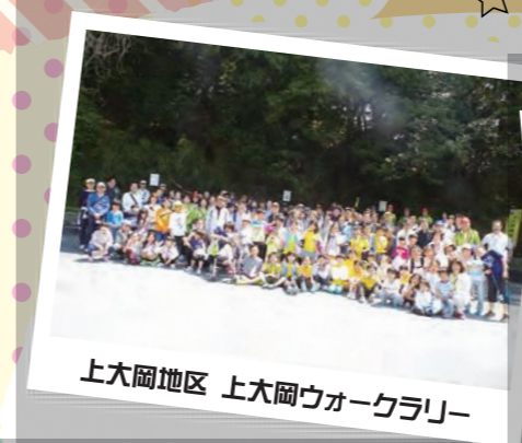
上大岡地区 上大岡ウォークラリー