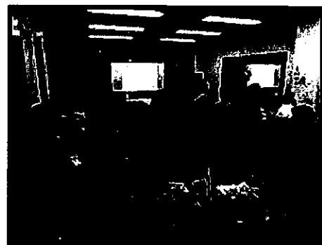
『聞いて、なるほど！ マヨネーズのお話』