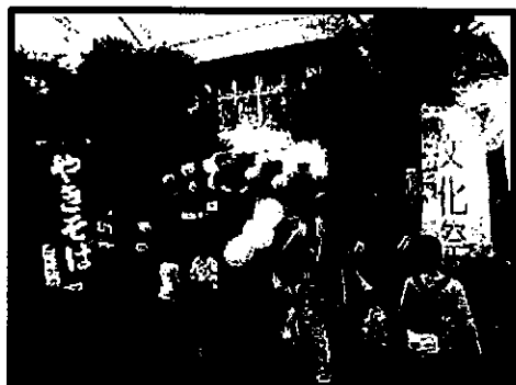
『港南区制50周年記念 桜道コミュニティハウス文化祭』