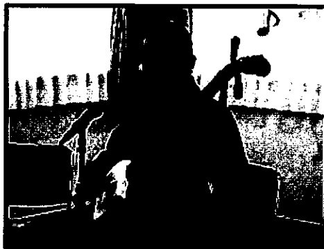
『港南区制50周年記念 桜道津軽三味線ライブ』