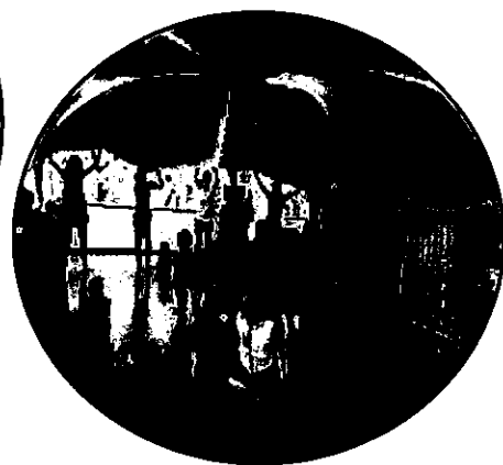
『さくらんぼひろば』