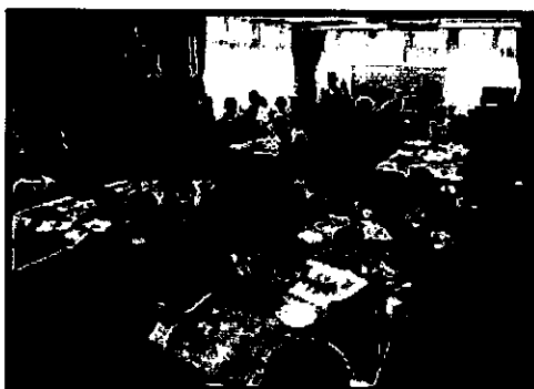
『ふしぎ発見理科クラブ リモコンカーを作ってみよう！』