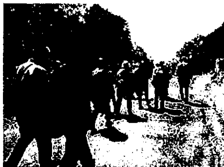
『こうなん路地裏さんぽ！ ～笹下城の歴史と郷土資料館』