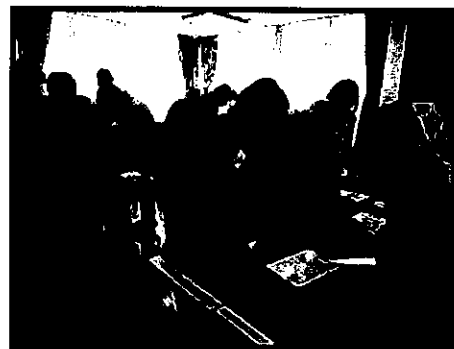
『くらしの達人DIY! 包丁の研ぎ方』