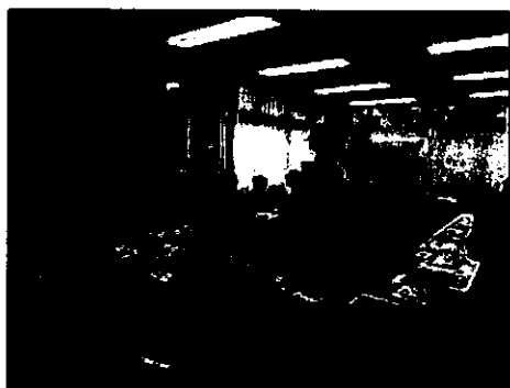
『お茶屋の女将さんの 目からウロコのお茶のいれ方』