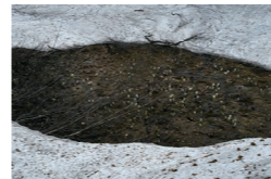
中井菜央 《20190603 野々海》2019年

あざみ野フォト・アニュアル 企画展 中井菜央展 +横浜市所蔵カメラ・写真コレクション展 写真表現の現在を切りとる企画展と横浜市所蔵カメラ・写真コレクション展を同時開催します。