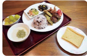
(左)一汁三菜プレート1,330円(税込) (右)シフォンケーキ220円(税込)

ぐるっと冬号をご持参でランチお召し上がりの方にシフォンケーキをお一つプレゼント 期間: 2022年3月31日まで