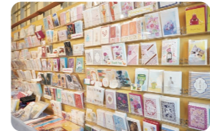
ポストカード 165円~(税込)

この時代だからこそ、手紙の良さを大事にしています。他ではなかなか見られない作家さんのカードなど、当店ならではの商品がお出迎えます。ぜひ贈りたい相手を思い浮かべながら選んでみてください!