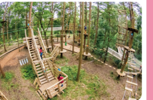
「よこはま動物園ズーラシア」に隣接。敷地内には手ぶらでマウンテンバイク体験ができる「トレイルアドベンチャー・よこはま」も！

自然に生えている木をそのまま生かして設計した、自然共生型の大規模なアウトドアパーク。ハーネスを装着して遊ぶコースでは、金具を使って安全を確保しながら、吊り橋やケーブルを渡っていきます。安全講習を受けた後、練習コースからまわるので初めてでも安心。