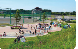
俣野遊水地 噴水広場。水遊びができるのもうれしいポイント

境川遊水地公園 サイクリストに人気の休憩スポット。ピオトープがあり、一年をとおして生き物の観察や水辺の風景が楽しめます。