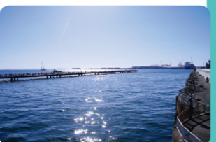
晴天の日は房総半島を眺めながら気持ちよく釣りができます

釣り初心者でも楽しめる、日本最大級の海釣り施設。釣り道具やフローティングベストのレンタルも可能で、お子さま連れも安全です。売店や食堂、展望休憩室もあり、一日中過ごせます！年に数回開催される、親子や初心者向けの釣り教室も人気。