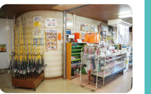
初心者向けの竿とリールがセットでレンタルできます

POINT 朝と夕方がおすすです。「アジを釣りたい」など具体的な目的があれば、場所や仕掛け、餌などのアドバイスをスタッフからもらえるので釣りやすくなりますよ。