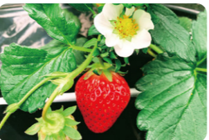
へタの付け根まで真っ赤ないちごがおすすめ

いちご狩り体験を中心に、いちごや野菜の直接販売も行なう農園。いちご狩りでは、王道のとちおとめ、よつぼし、あきひめなど11品種のいちごを食べ比べることができ、練乳をおともに好きな品種を探せます。天候に左右されないビニールハウスです。