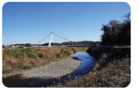
鷺舞橋(ささまいばし)。境川にかかる曲線吊り橋

境川沿いの歩行者・自転車道路。ここでは境川遊水地公園周辺の気持ちよく走れるコースをご紹介します！