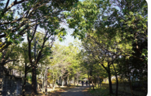
緑に囲まれ、癒やされます

くさぶえのみち スタートから約2km先の徳生公園に、道を通れるせせらぎの終点。中央に池があり、魚や鳥を観察できます。