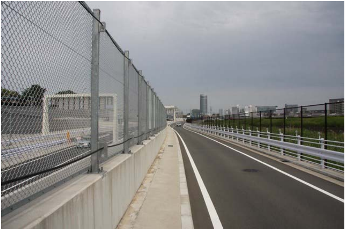
鶴見川上流側から