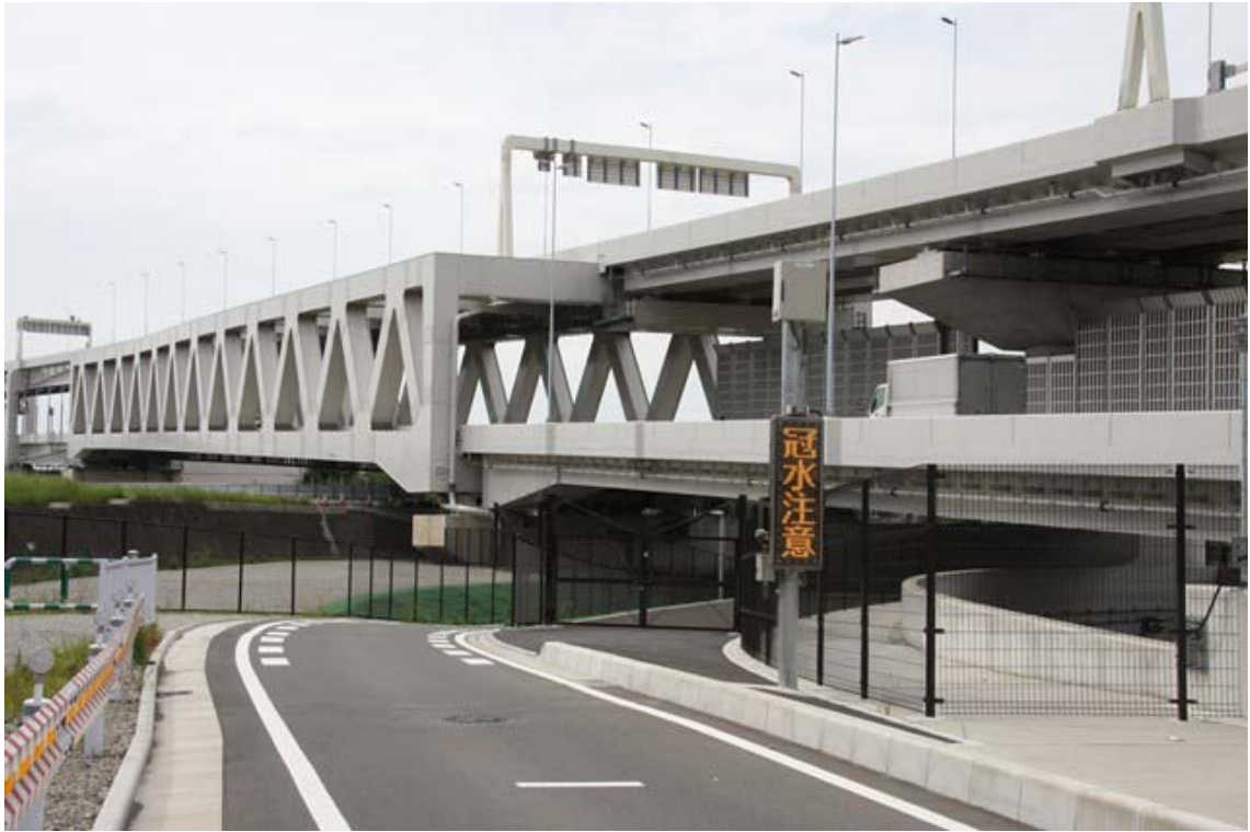
鶴見川下流側から