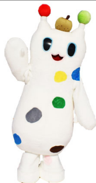
戸塚区マスコット「ウナシー」