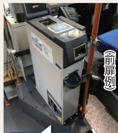
前乗り車両では、運転席の隣に運賃箱があります。