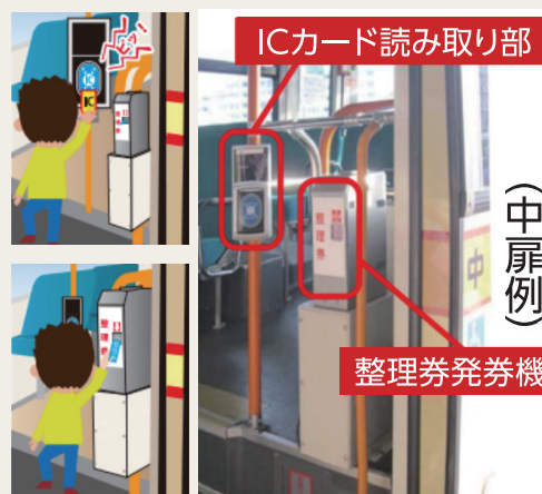
ICカード読み取り部