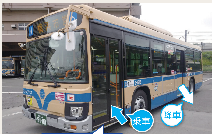
バス前方のドアから乗車し、降車は後方のドアになります。