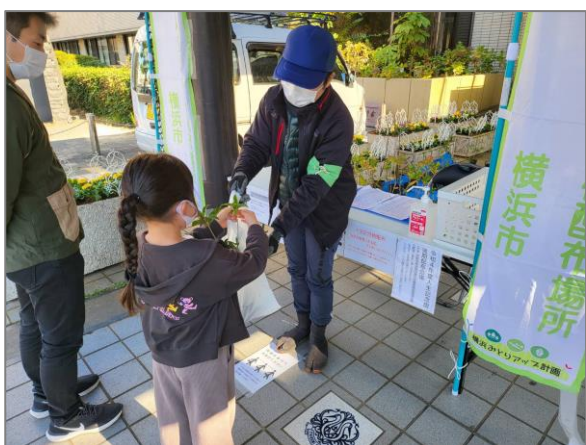
24 人生記念樹の配布 (鶴見区庁舎)