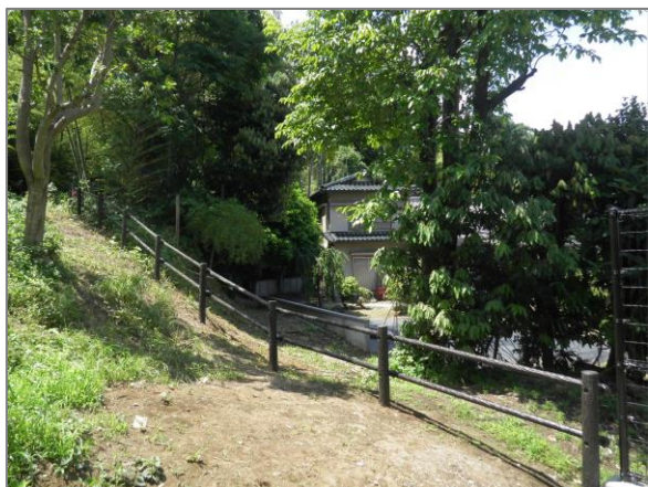
1 保全した樹林地の整備 (東寺尾ふれあいの樹林)