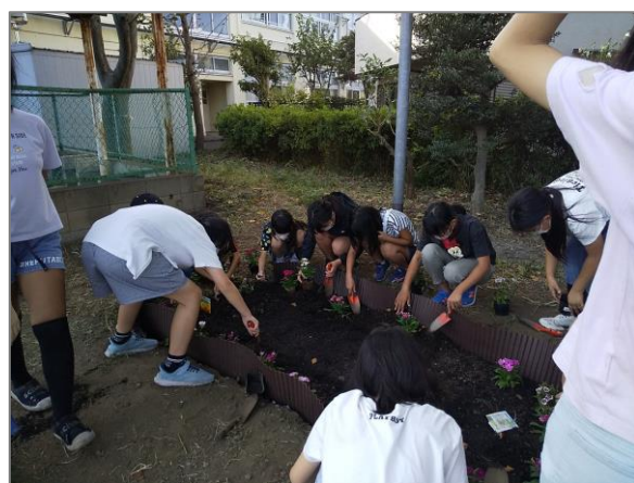
25 小学校での緑の創出・育成 (区内小学校)