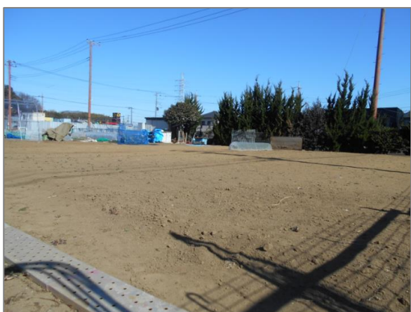
12 市民農園の開設 (獅子ヶ谷三丁目)