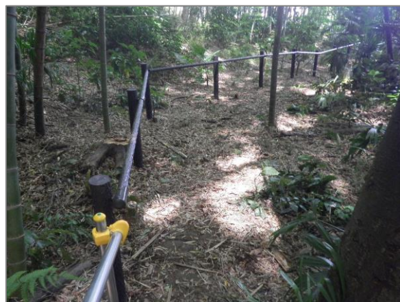
1 保全した樹林地の整備 (獅子ヶ谷市民の森)