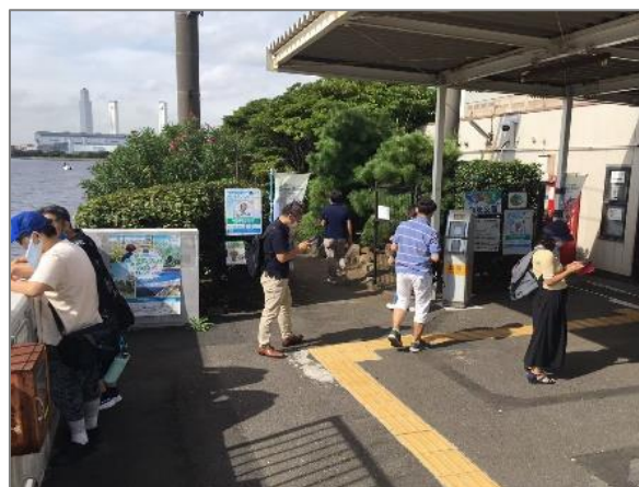
23 緑や花を身近に感じる各区の取組 (JR 鶴見線で巡る 緑のスタンプラリー)