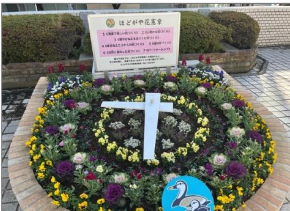
23 地域の花いっぱいにつながる取組 （保土ヶ谷区庁舎）