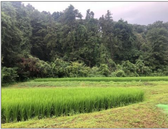
8 水田の保全 （川島町）