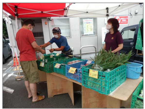
14 青空市・マルシェ等 （和田町駅前直売会）