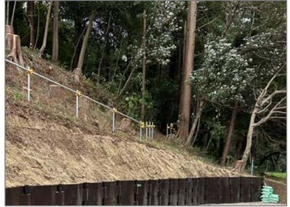
1 保全した樹林地の整備 （今井町特別緑地保全地区）