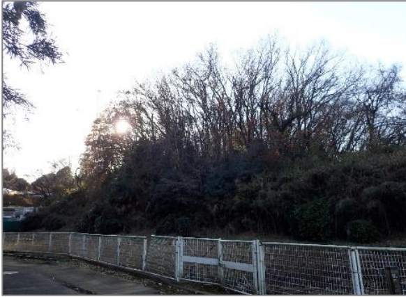
1 緑地保全制度による新規指定 源流の森保存地区（仏向町）