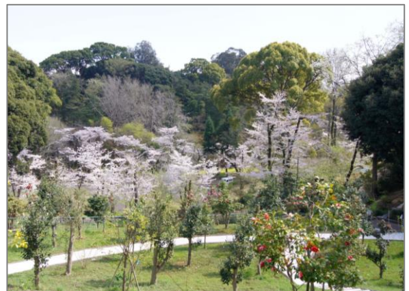
26 緑花による空間づくりと維持管理 （横浜市児童遊園地）