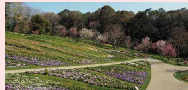
里山ガーデン(旭区)

都心臨海部などの多くの市民が訪れる場所において、花や緑による空間づくりや質の高い維持管理を集中的に展開(15か所)