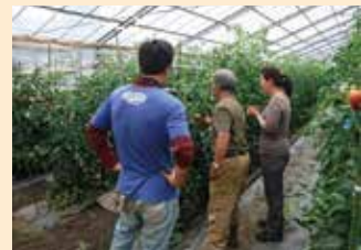
はまふうどコンシェルジュ講座・直売体験(泉区)