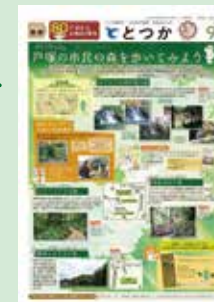
広報よこはま(区版)の特集記事掲載