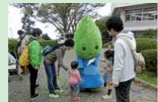
イベントでのPR(保土ヶ谷区)