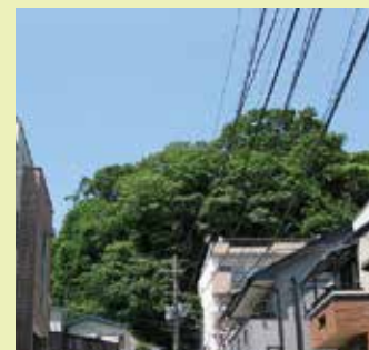
新規指定した緑地保存地区(南区)