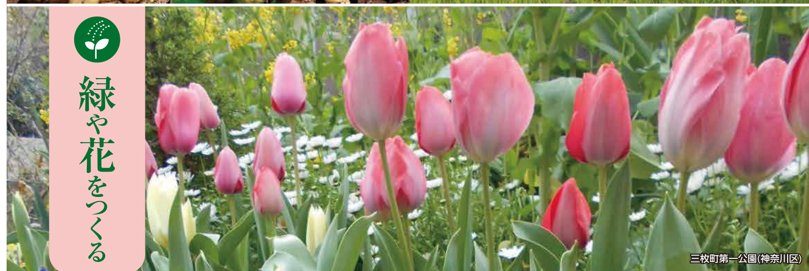
三枚町第一公園(神奈川区)

緑の減少に歯止めをかけ、「緑豊かなまち横浜」を次世代に継承するため、「横浜みどり税」を一部財源として活用しながら、「横浜みどりアップ計画[2019-2023]」を進めています。このリーフレットは、2019(令和元)年度の実績の概要です。