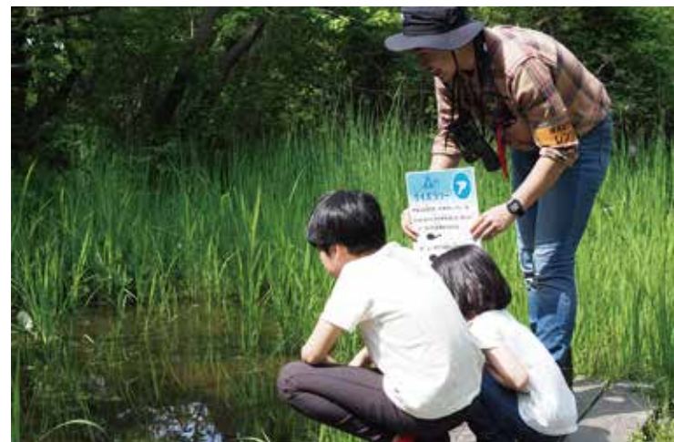
ウェルカムセンターでの自然観察会の様子(栄区)