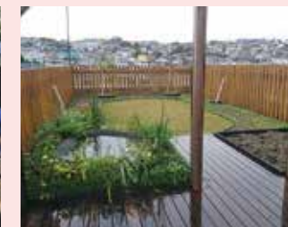
保育園の屋上園庭緑化(保土ヶ谷区)