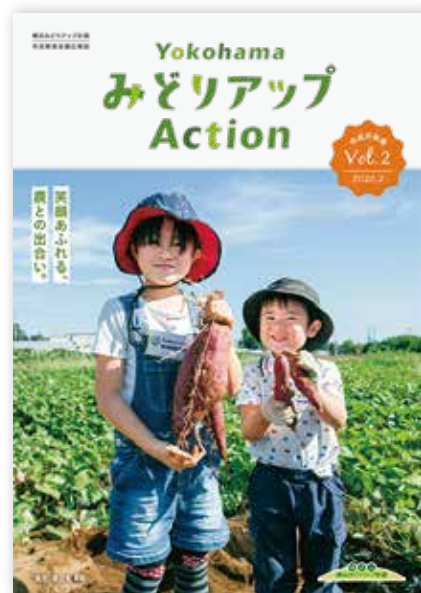
広報誌「みどりアップAction」