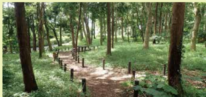
維持管理を実施した樹林地(泉区)