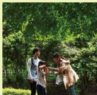
よこはま森の楽校(緑区)