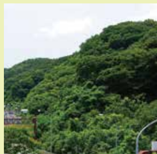
土地の買取りをした近郊緑地特別保全地区(金沢区)