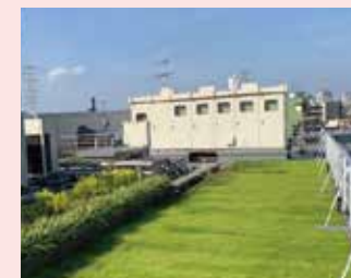
病院屋上での緑化整備(鶴見区)