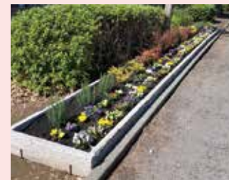
大倉山地区(港北区)

地域の団体から緑化提案を公募し、緑化計画の策定・緑化整備を支援(新規:4地区 継続:12地区)