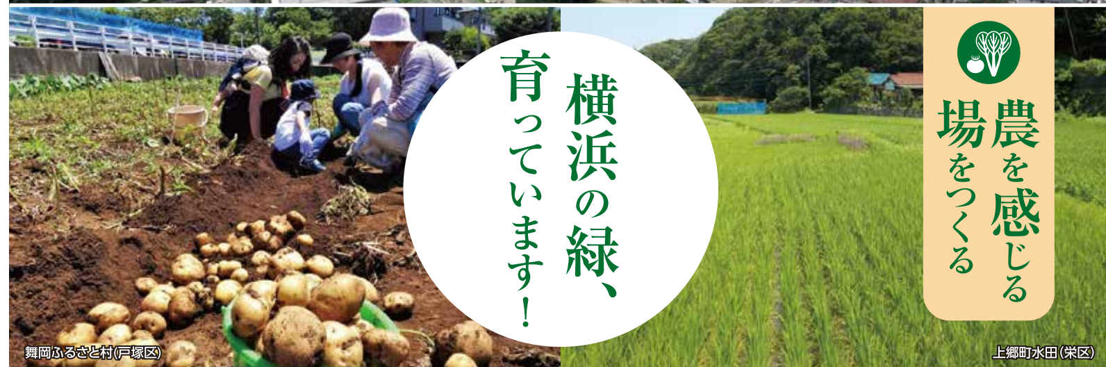
舞岡ふるさと村(戸塚区)