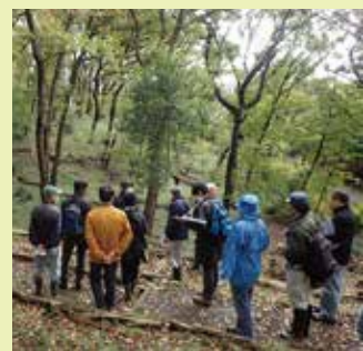
森づくり活動団体への専門家派遣(都筑区)