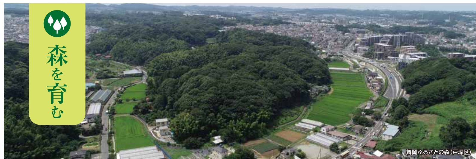
舞岡ふるさと村(戸塚区)