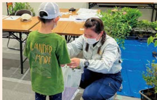
人生記念樹の配布

また、オープンガーデンや緑道での花壇の植栽、公園での花苗や球根の植付けなど地域に根差した各区での取組を支援し、身近な場所で緑や花とふれあう機会を創出するとともに、緑や花の活動を一緒に行うことで子どもたちが地域とつながる機会にもなっています。