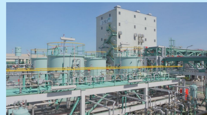
バイオ燃料製造実証プラント