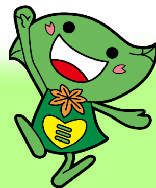
⑪ 元気づくりのひろば