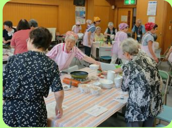
⑧ 元気じょうずになるサロン