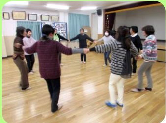
⑥ いきいき会 休止中