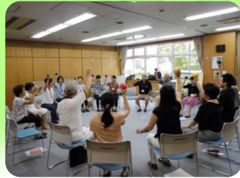
⑩ 元気いきいき体操