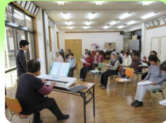
⑬ 気楽お気楽クラブ