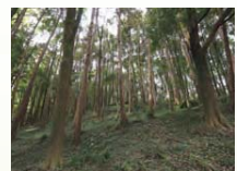
▲三保市民の森(三保町)

【問合せ】環境創造局 みどりアップ推進課 (〒231-0017 中区港町1-1 ☎671-2712 ☎224-6627)