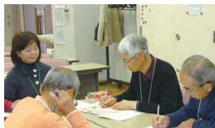
▲食材、献立、役割分担を考えます

①11月21日②28日(月)9時30 分~11時30分③12月5日(月)9時 30分~14時 ④東本郷地域ケアプ ラザ ⑤①栄養と認知症予防の話② 食材・献立・役割分担を考える③調理に 挑戦 ④全回参加可能な60歳以上の 横浜市内在住者、先着15人 ⑤材料 費実費 ⑥10月20日から電話で、区 高齢者支援担当(☎930-2311 ☎ 930-2310)へ ※料理教室では ありません