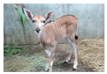
▲エランドの赤ちゃん。まだ角がありません

旭区上白根町1175-1 ☎959-1000 http://www.hama-midorinokyokai.or.jp/zoo/zoorasia/