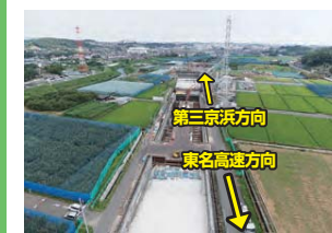
▲U型擁壁・開削トンネルの建設現場(北八期町)