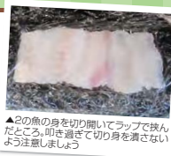
▲2の魚の身を切り開いてラップで挟んだところ。叩き過ぎて切り身を潰さないよう注意しましょう