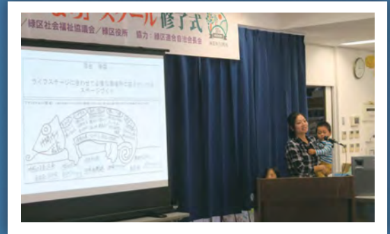
修了式では「夢プラン」を発表します。ママ、がんばってね!