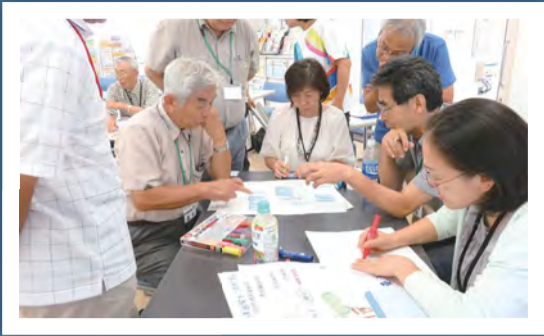
「夢プラン」は、講師の指導や先輩たちのアドバイスで、考えがまとまっていきます。