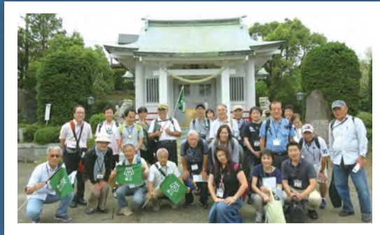
街を歩き、街を知るフィールドワーク