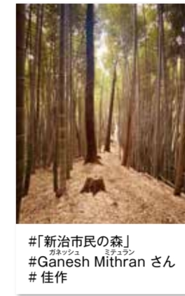
「新治市民の森」 #佳作