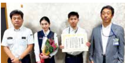
JR 東日本 中山駅