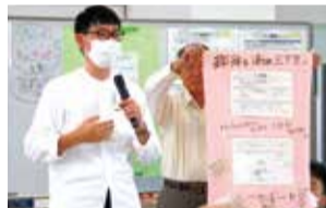
▲私の「夢プラン」を発表!

みどり「ひと・まち」スクールは、緑区をより素敵な「まち」にしたいという思いを持った人たちが参加する学校です。意見交換しながら「夢プラン」(活動プラン)を作りましょう!