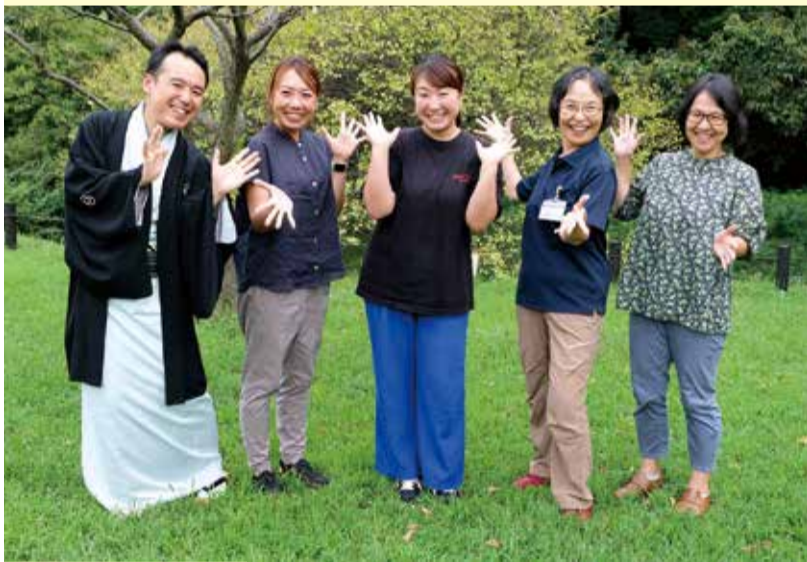
ナビゲーターの皆さん

ガイドには、今まさに緑区で活躍されている方々が「ナビゲーター」として登場!ナビゲーターならではの視点で、まちの魅力を紹介しています。 また、ナビゲーターの皆さんと緑区職員で座談会も実施。緑区で育まれてきたまちの魅力、そして緑区のこれからについて、和気あいあいと語り合った座談会の様子も、巻末に収録しています。