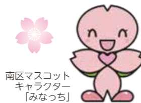
南区マスコット キャラクター 「みなっち」