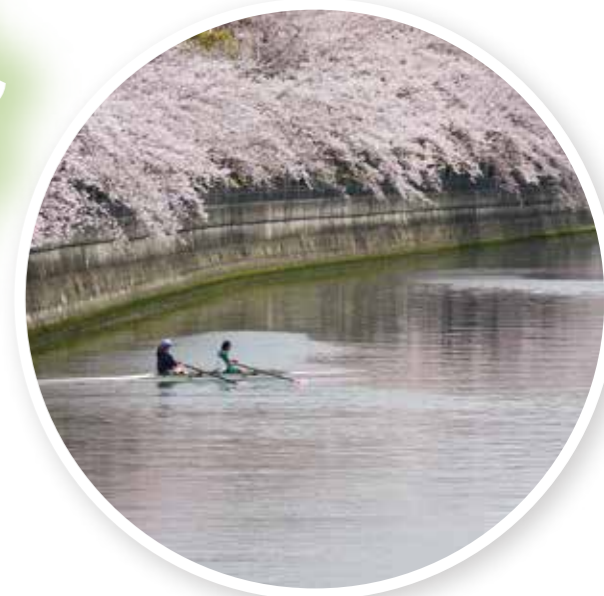
本大岡からみた大岡川と桜