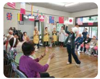
高齢者の居場所「大岡川ふれあいサロン」