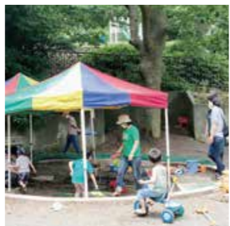
くみょうじプレイパーク