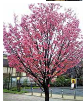
弘明寺前田 公園前の桜