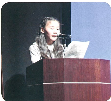
司会 一語一語はつきりと

作文表彰、運営、エキシビジョンの演奏、それぞれに参加の形は異なりますが、皆がひとつになって式典を開催、感動の一日となりました。