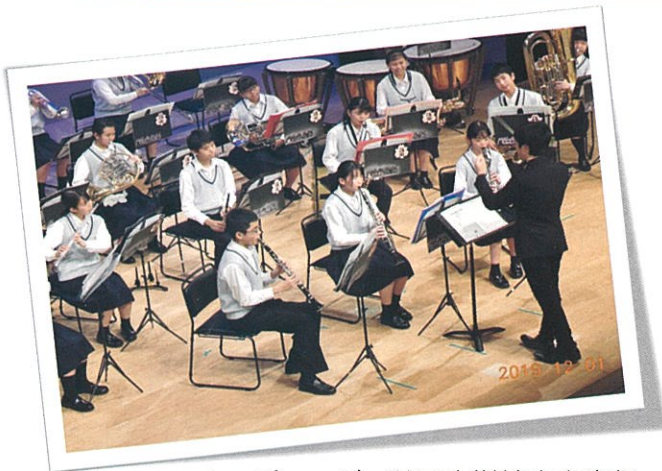
オープニング 蒔田中学校吹奏楽部

令和元年12月1日、みなみん（南公会堂）において第39回ボイス・オブ・ユースが開催されました。記念式典では厳粛な雰囲気の中、来賓の皆様よりご祝辞をいただきました。引き続き優秀作文の表彰、発表が行われました。