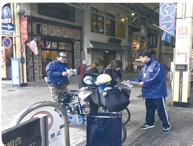
弘明寺商店街にて啓蒙チラシ配布の様子

ただ、現在子育て中の若い世代では、ボイス・オブ・ユースの存在や青少年指導員の活動をご存知なかったりする現実があり、活動への理解の難しさを実感いたしました。また、子どもさ