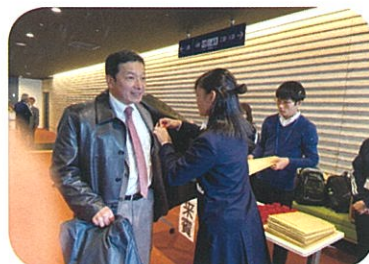
受付、会場案内 来賓の方のお迎え