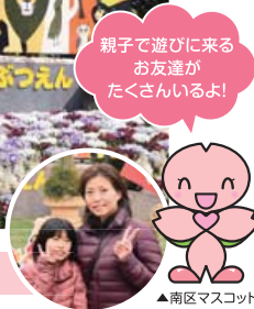
▲南区マスコットキャラクター「みなっち」