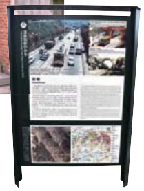
▲橋の西区側には、市電が走っていた当時の様子を知ることができる案内板があります