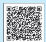
横浜市動物愛護センターホームページ▲

■ 横浜市の委託を受けた動物病院で注射をされた場合 狂犬病予防注射と狂犬病予防注射済票の交付手続が同時にできます。委託動物病院の一覧や必要な手続については横浜市動物愛護センターのホームページをご確認ください。