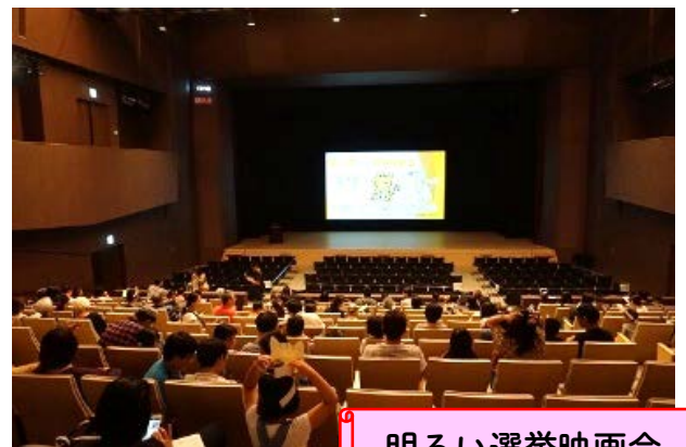
明るい選挙映画会

将来の有権者である、区内の小、中、高等学校の生徒を対象として、選挙に対する理解を深めてもらうため、学校の生徒会選挙等の際に、投票器材を貸し出し、投票模擬体験をしていただきます。