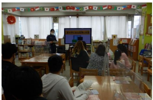
外国人への生活ガイダンスの様子

区内に暮らす外国籍等の住民と地域社会がともに暮らしやすいまちづくりを進めるため、区役所やみなみ市民活動・多文化共生ラウンジにて情報提供や生活相談等を行います。