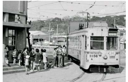
滝頭車庫から出発