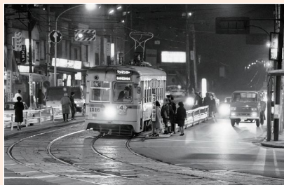
元町 1970(昭和45)年2月21日