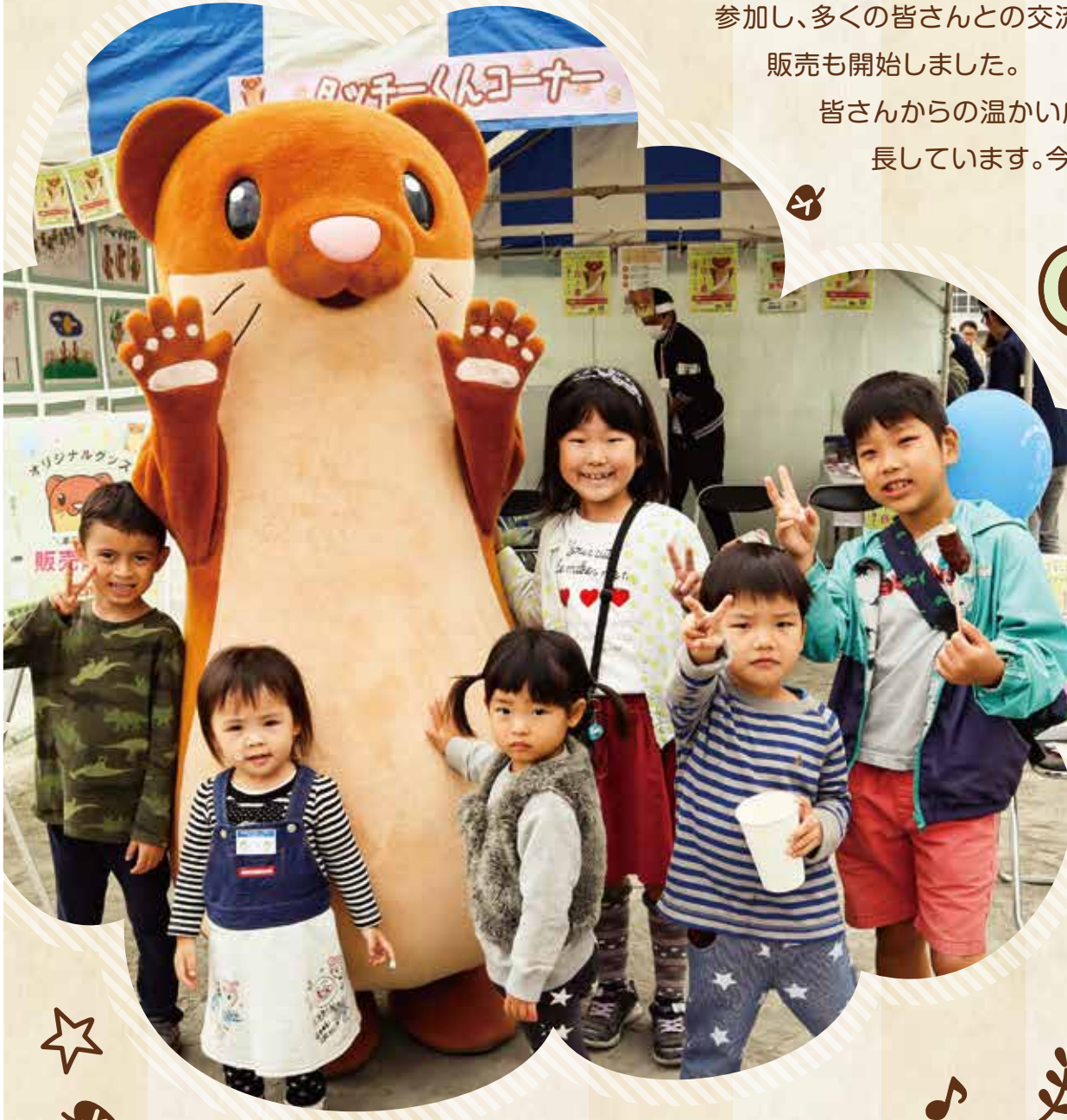
▲第19回栄区民まつり タッチーくんコーナー

皆さんからの温かい応援が支えとなり、タッチーくんは日々成長しています。今回はそんな「タッチーくん」の特集です。