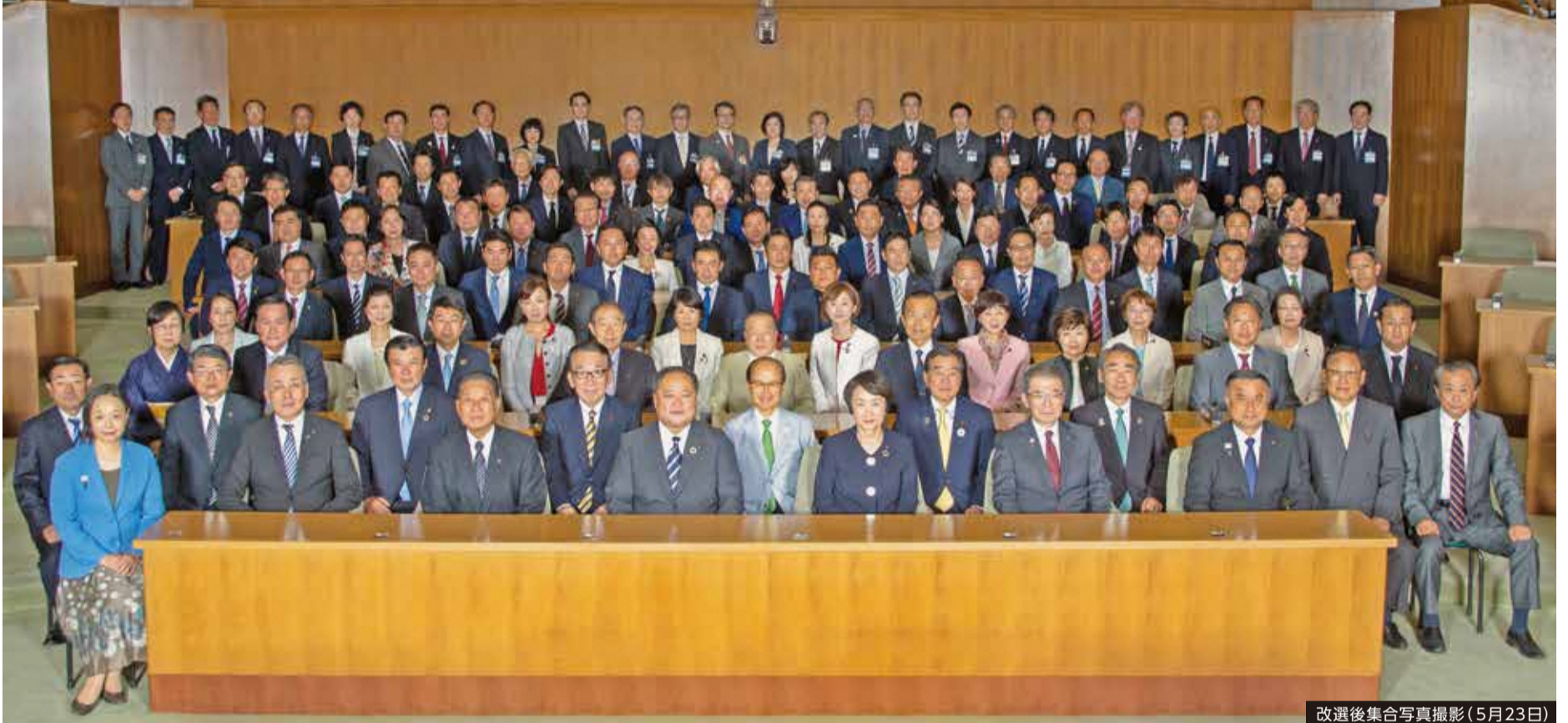
改選後集合写真撮影(5月23日)

4月7日に行われた市議会議員選挙で86人の議員が選ばれ、4月30日から新たな任期が始まりました。(4面に「各区選出の市会議員」を掲載しています。)