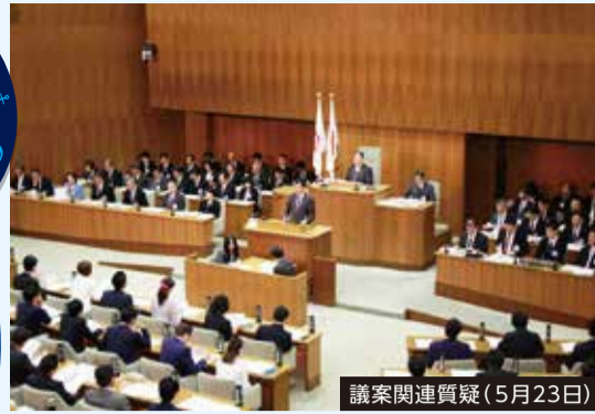
議案関連質疑(5月23日)

横浜市議会事務局 〒231-0017横浜市中区港町1-1 TEL 045-671-3040 FAX 045-681-7388 https://www.city.yokohama.lg.jp/shikai/