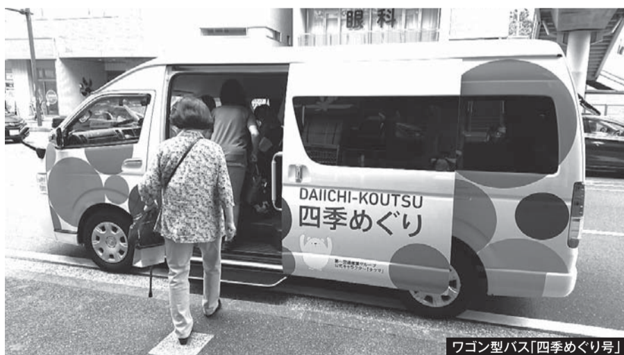
ワゴン型バス「四季めぐり号」

生活に密着した交通手段の導入に向けて、地域の主体的な取組がスムーズに進むように、実現にいたるまでの活動に対して支援を行う事業。