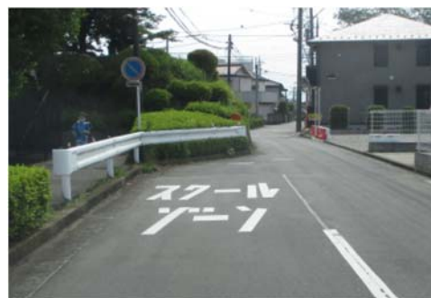
通学路 路面標示の補修