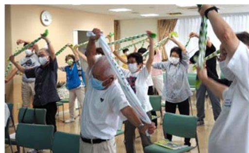
神奈川区オリジナル介護予防体操 「かめ亀手ぬぐいサイズ」