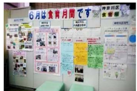
食育展（区庁舎1階ホール）