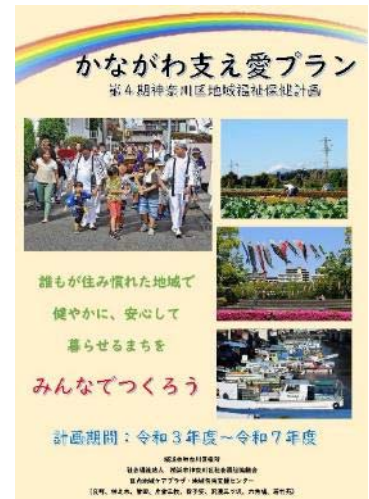
かながわ支え愛プラン（案） （第4期地域福祉保健計画） ※3月完成予定