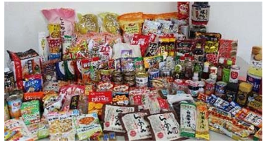
寄付受付食品(フードドライブ)