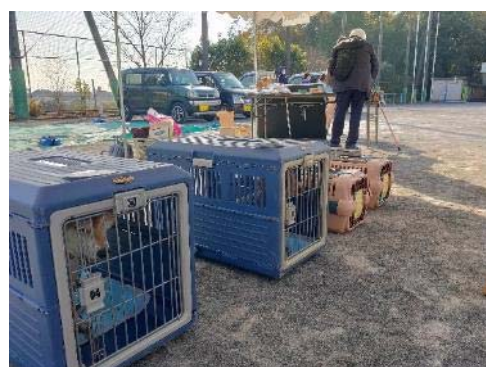
地域防災拠点でのペット同行避難訓練