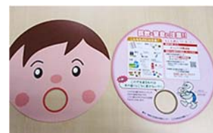
誤飲予防啓発うちわ