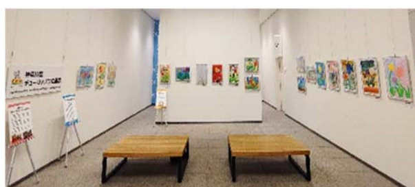
令和3年度チューリップ写生画展 (横浜市役所1階展示スペース)