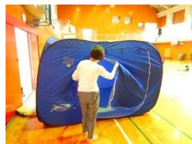
風水害避難場所運営訓練