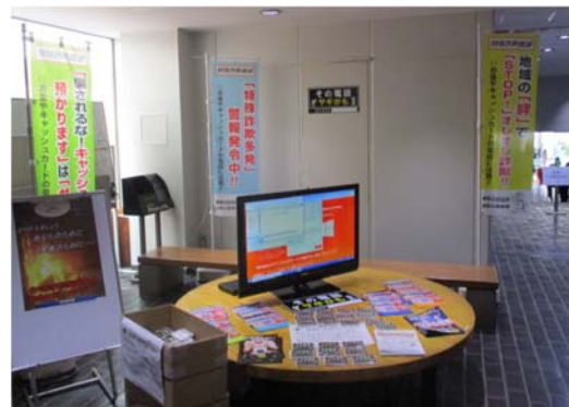
ワクチン接種会場での DVD 上映等による啓発活動