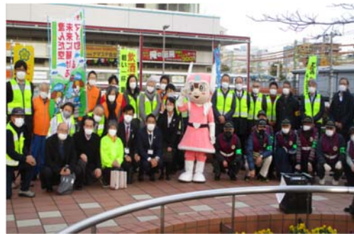
警察と連携した交通安全啓発活動