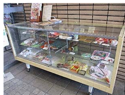
自主製品展示 (別館玄関)