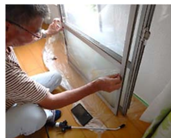
窓ガラス飛散防止フィルム 施工作業