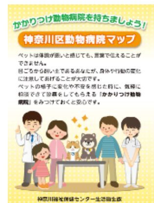
かかりつけ動物病院啓発リーフレット

飼い主へ普段から何でも相談できる「かかりつけ動物病院」を持つことや、気象災害・火事等の被災や飼い主の入院等によるペットの一時預け先を考えておくことについて、リーフレットにより啓発