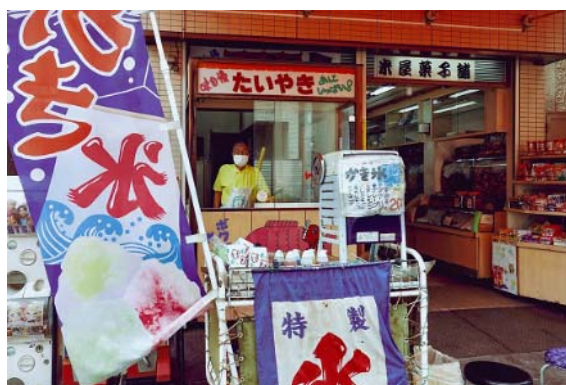
第13回「わが町かながわとっておき」写真コンテスト（令和3年度） 【小中学生部門】最優秀作品

「海と緑と丘のまち神奈川区」の魅力を表現する写真を小中学生、一般より募集し、入賞作品を用いた魅力発信を行います。（8月～3月）