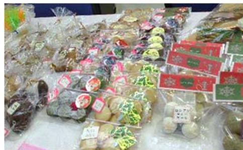
障害者週間啓発販売