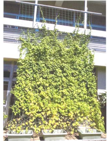
緑のカーテン育成の様子 (幸ヶ谷公園コミュニティハウス)