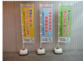
特殊詐欺のぼり旗