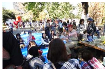
外遊び体験イベント (反町公園)