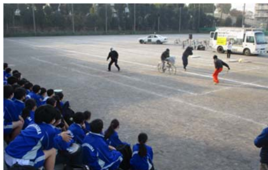
中学校で実施した交通安全教室