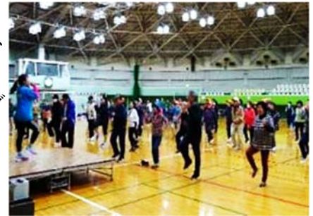
さあ！歩こう健康ウォーキング （平沼記念体育館）