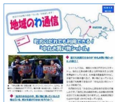
「地域のわ通信」の発行

区内で行われている特色ある地域活動の事例を広く区民に紹介する情報紙「地域のわ通信」の発行(通年)