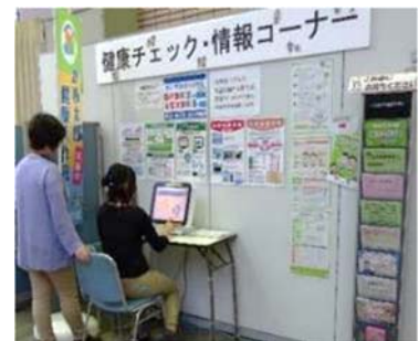
健康チェック・情報コーナー