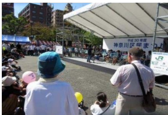
区民まつり(平成30年度)反町公園での開催の様子