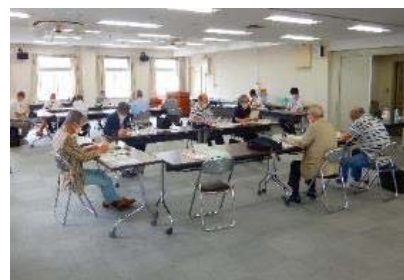
運営委員向け防災講座

運営委員向け防災講座及び運営マニュアルの改訂支援 地域防災拠点の環境整備(備蓄庫の修繕等)