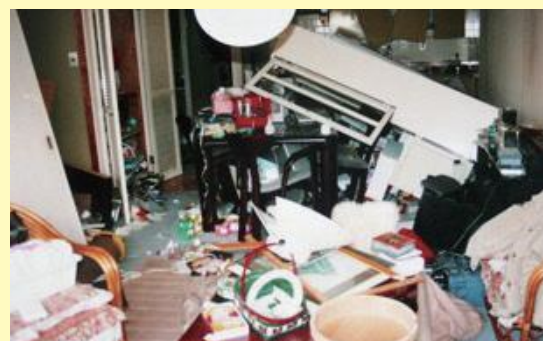
平成7年 阪神淡路大震災 地震後の家の中の様子

自宅で避難生活を送るためには、自宅の安全を確保できる状態であることが大前提です。建物自体が無事でも部屋の中が危険な状態だと生活も困難になります。