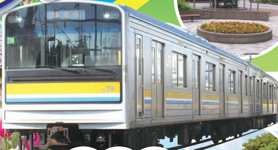
ゲートプラザ公園 (最寄駅: 弁天橋駅)