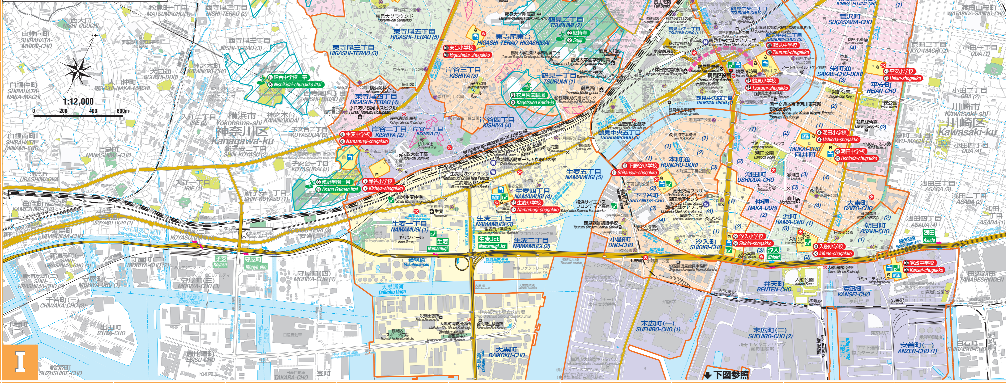
この地図の作成に当たっては、国土院院長の承認を得て、国院発行の1万分の1地利図を使用した。(承認番号 平24情発 第74-1048460号)