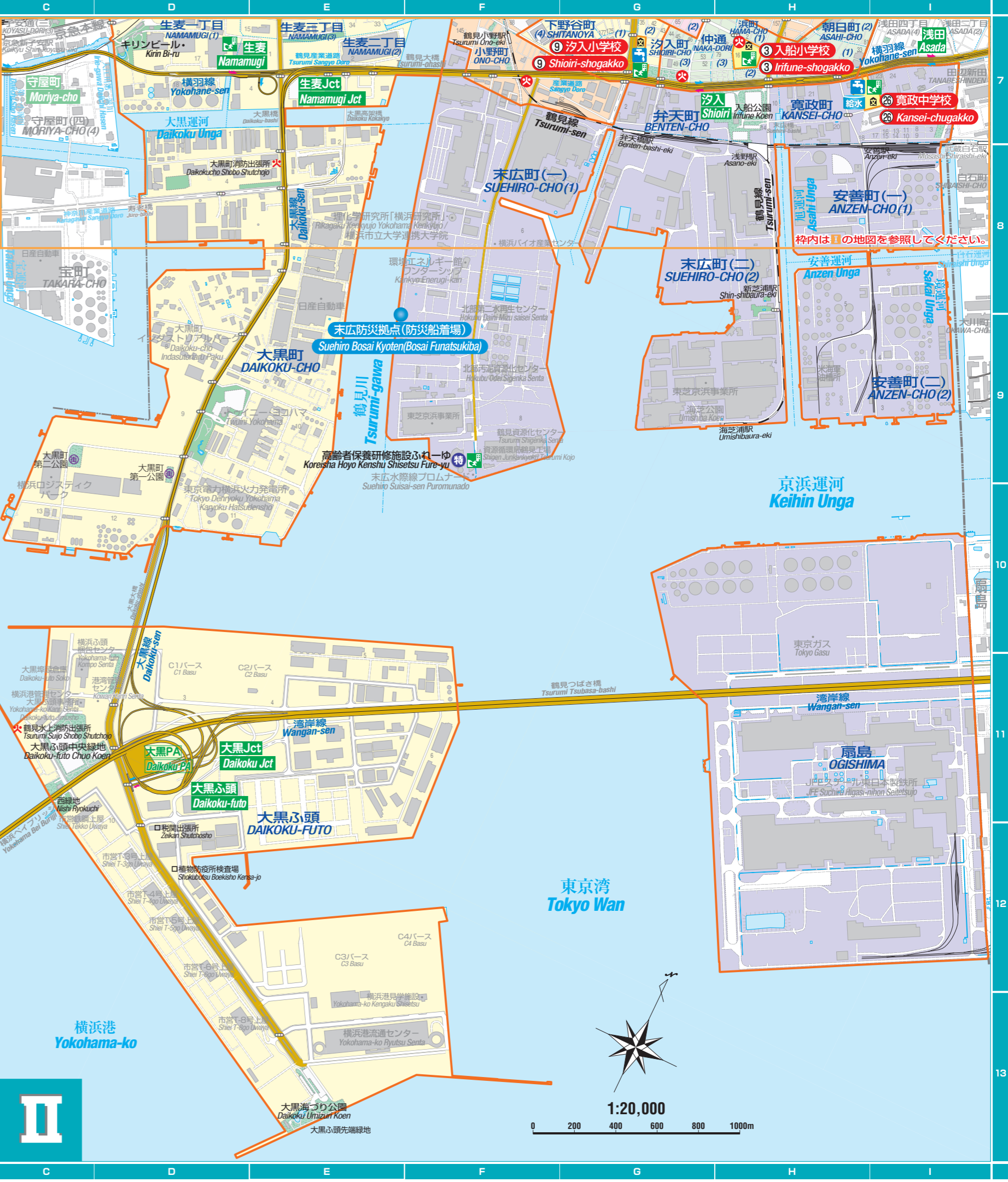
この地図の町界線は地籍の配置等に基づき描いたものであり、地籍関係の権利関係を表しているものではありません。